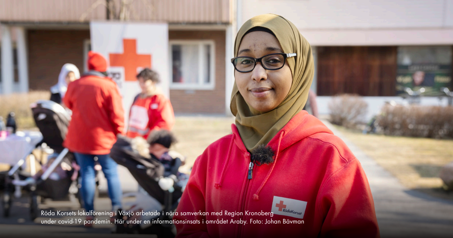
Röda Korsets lokalförening i Växjö arbetade i nära samverkan med Region Kronoberg under covid-19 pandemin. Här under en informationsinsats i området Araby.