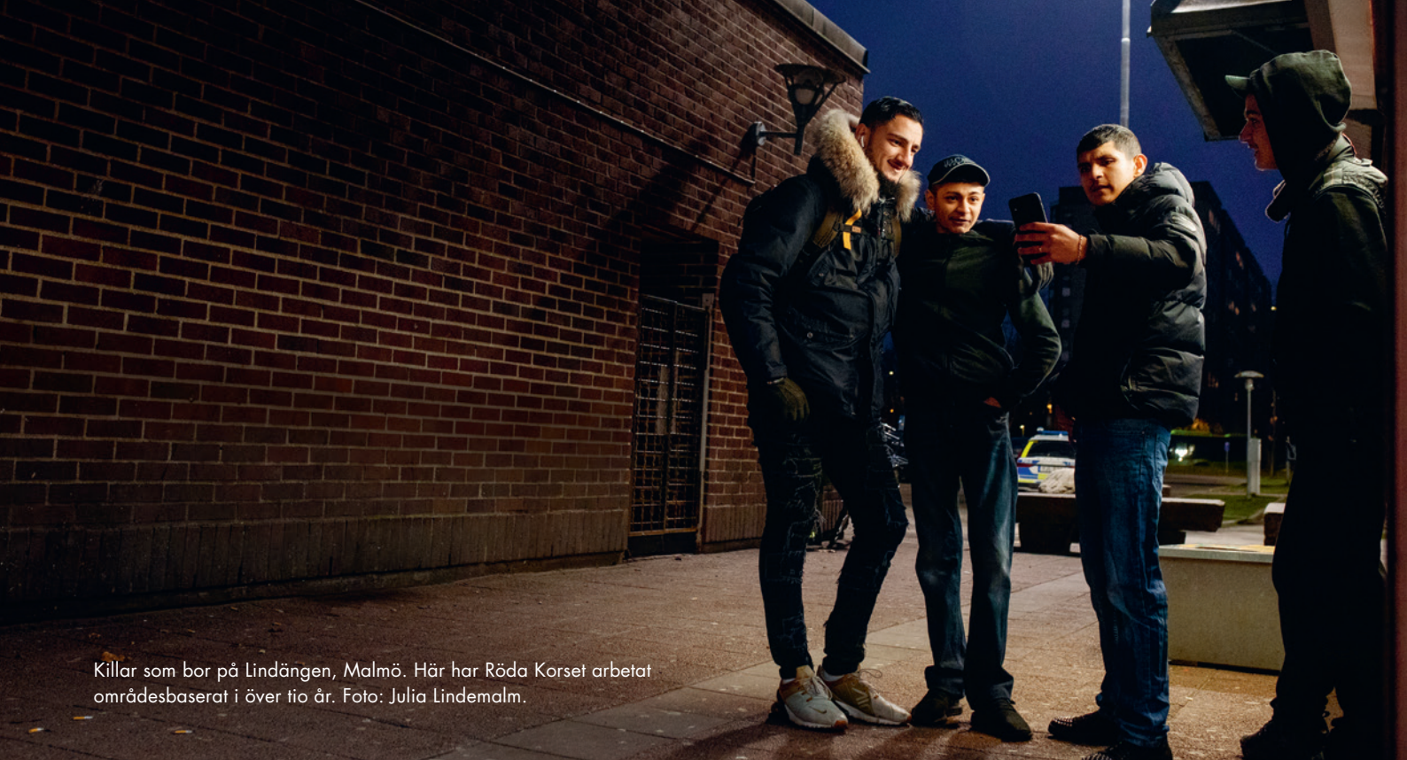
Killar som bor på Lindängen, Malmö. Här har Röda Korset arbetat områdesbaserat i över tio år.

Sammanlagt bor 1,4 miljoner i befolkningen i områden med socioekonomiska utmaningar, varav drygt en halv miljon i områdestyp 1. Områden med socioekonomiska utmaningar har blivit fler i Sverige mellan 2011 och 2021, och även om de finns runtom i landet är de vanligare runt större städer och i storstadsområdena. Enligt Boverkets årsrapport från 2023 har fler än hälften av landets kommuner områden med socioekonomiska utmaningar.