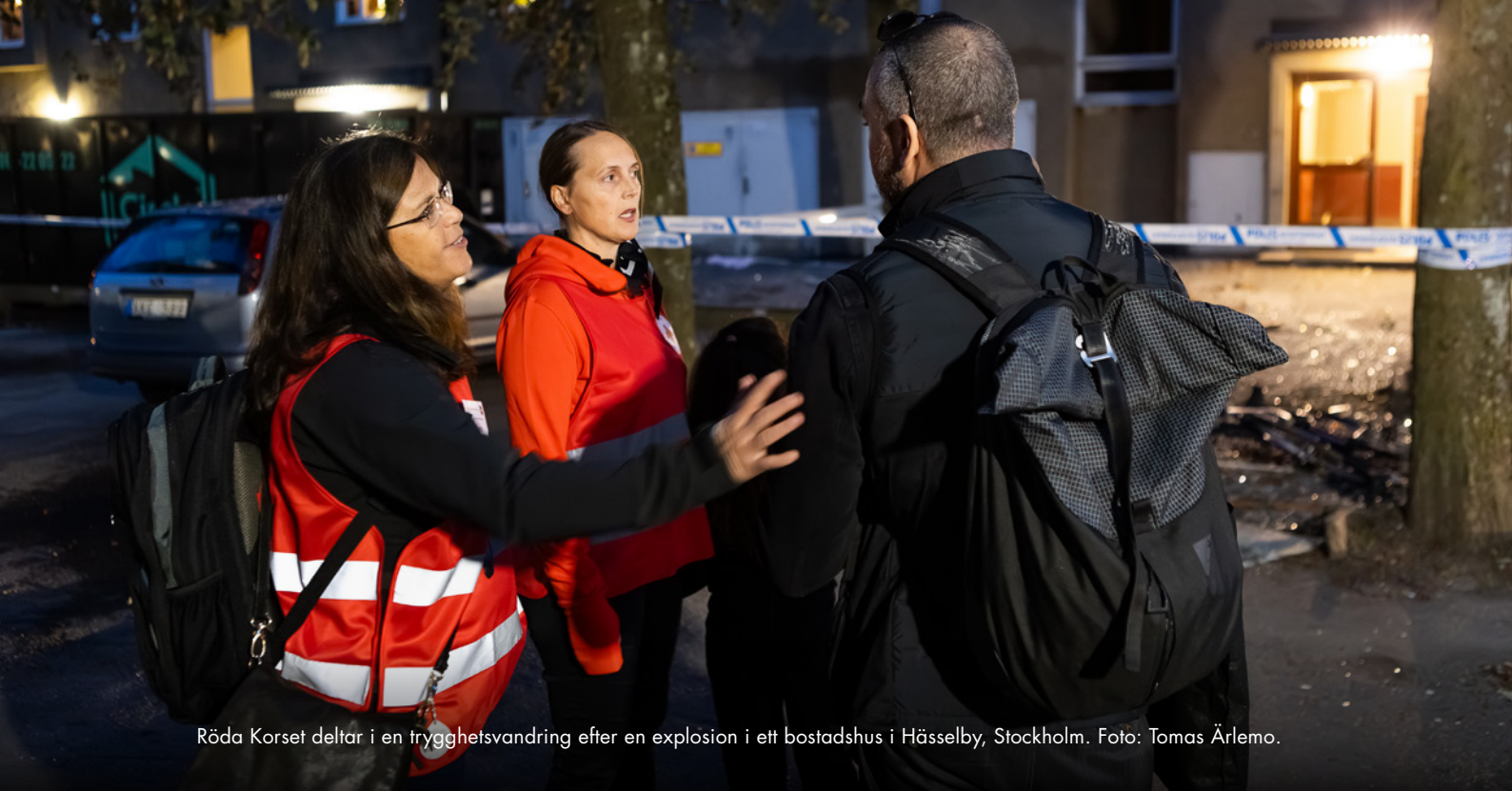
Röda Korset deltar i en trygghetsvandring efter en explosion i ett bostadshus i Hässelby, Stockholm.