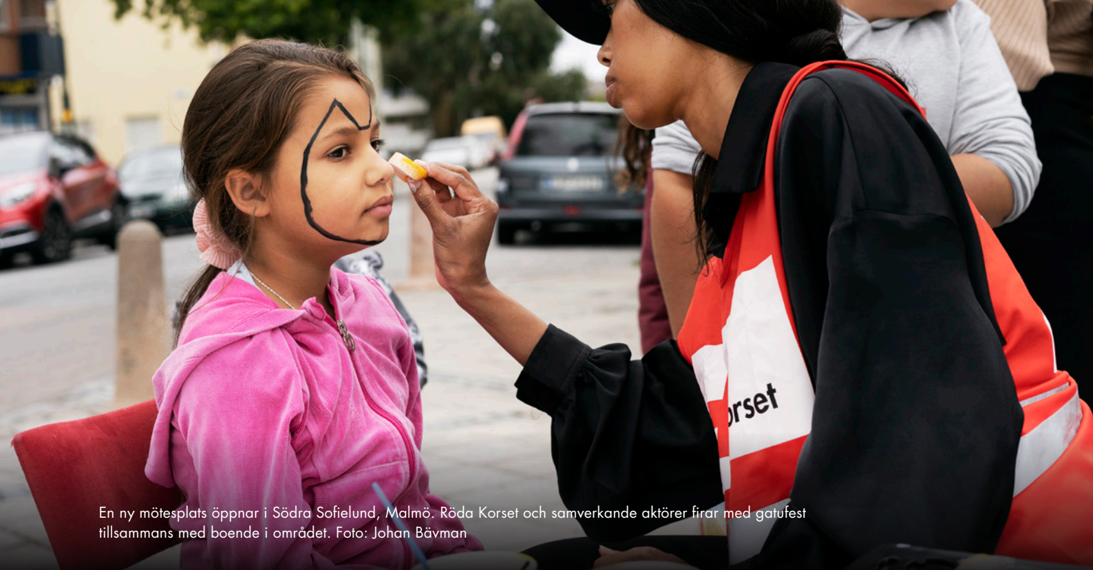
En ny mötesplats öppnar i Södra Sofielund, Malmö. Röda Korset och samverkande aktörer firar med gatufest tillsammans med boende i området.