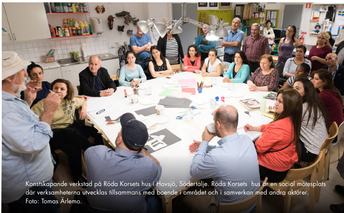
Konstskapande verkstad på Röda Korsets hus i Hovsjö, Södertälje. Röda Korsets hus är en social mötesplats där verksamheterna utvecklas tillsammans med boende i området och i samverkan med andra aktörer.

Det saknas idag tillräcklig forskning på de långsiktiga konsekvenserna av att leva i ett område som präglas av hög våldutsatthet. Under 2024 planeras ett tvärvetenskapligt forskningsprojekt på Uppsala universitet som ska undersöka hur människors hälsa påverkas i områden där det skjuts. Man kommer bland annat studera om dåden har mätbara effekter på vårdbesök, läkemedelsförskrivning, sjukdagar och betyg. 12