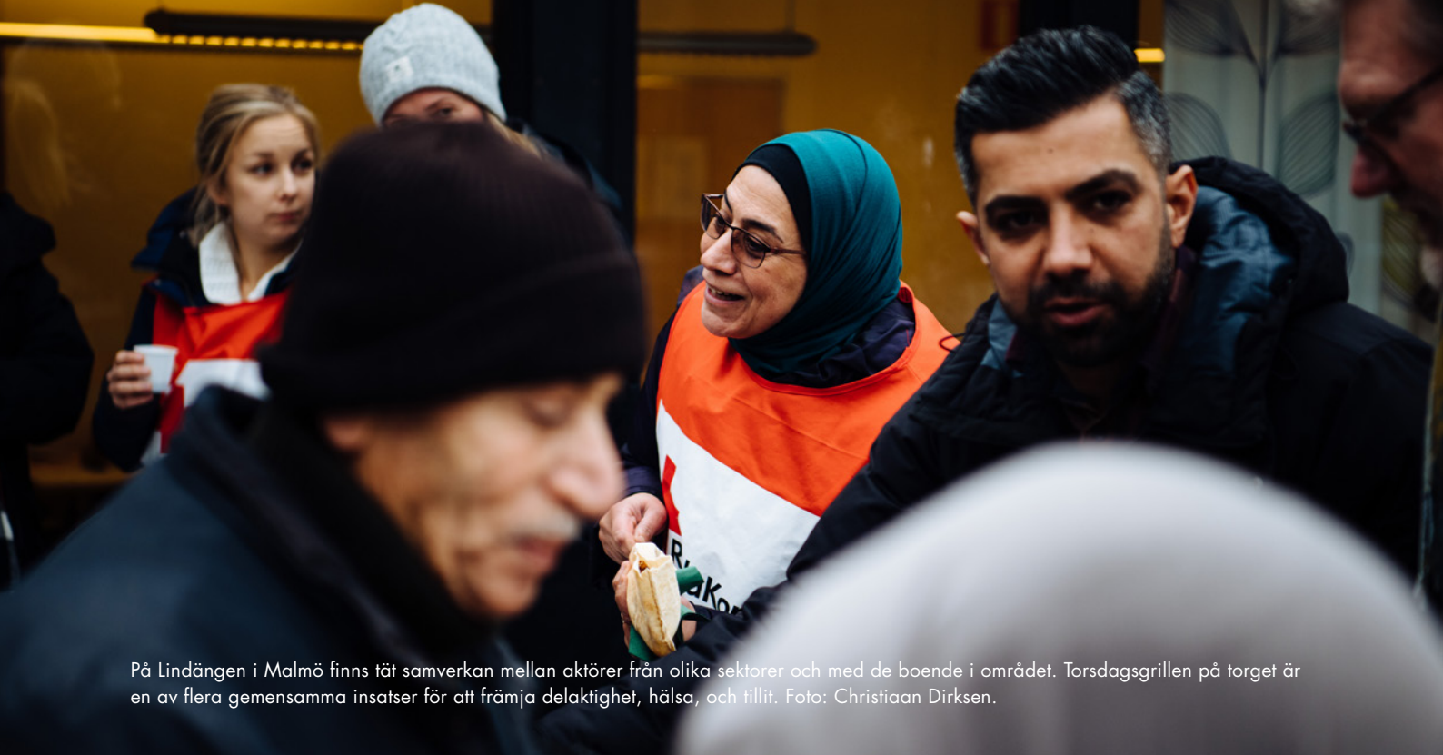
På Lindängen i Malmö finns tät samverkan mellan aktörer från olika sektorer och med de boende i området. Torsdagsgrillen på torget är en av flera gemensamma insatser för att främja delaktighet, hälsa, och tillit.