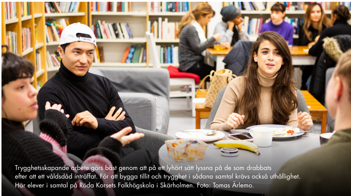
Trygghetsskapande arbete görs bäst genom att på ett lyhört sätt lyssna på de som drabbats efter att ett våldsdåd inträffat. För att bygga tillit och trygghet i sådana samtal krävs också uthållighet. Här elever i samtal på Röda Korsets Folkhögskola i Skärholmen. Foto: Tomas Ärlemo.

Det finns dock en tydlig tendens att aktörer med ansvar för sociala verksamheter (snarare än tekniska, exempelvis) inte har en uttrycklig roll i svensk krisberedskap. Varken Socialtjänsten, Skolverket, Boverket 17 eller Myndigheten för delaktighet ses som centrala inom krisberedskapssystemet. I flera av de senaste årens kriser, och i synnerhet under coronapandemin, har dock skolan och socialtjänsten varit nyckelaktörer för att hantera konsekvenserna av samhällsstörningar.