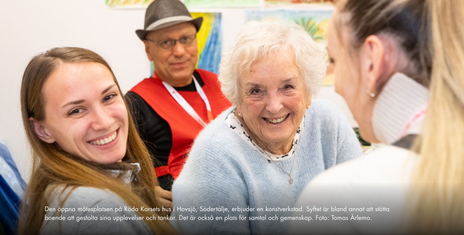
Den öppna mötesplatsen på Röda Korsets hus i Hovsjö, Södertälje, erbjuder en konstverkstad. Syftet är bland annat att stötta boende att gestalta sina upplevelser och tankar. Det är också en plats för samtal och gemenskap.

Trygghet och säkerhet handlar mycket om relationer, och förståelse kring vem som gör vad i samhället under ordinarie läge och vem som har ansvar att också göra saker när krisen inträffar. Civilsamhällsaktörer har ofta en bred räckvidd och kan tillgängliggöra att stöd och adekvat information når ut till fler. Mitt under krisen kan man inte förvänta sig att ett samarbete ska uppstå utan det här behöver förberedas och ske utifrån verklig inkludering och delaktighet, inte att en aktör använder en annan.