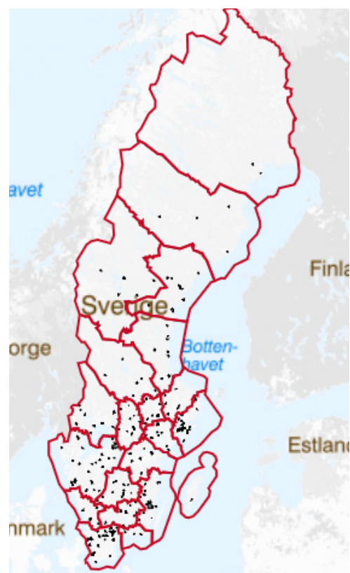
För att utforska ojämlikhetsindex och områdestyper över hela Sverige, gå till interaktiv karta på boverket.se