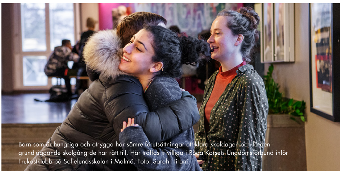
Barn som är hungriga och otrygga har sämre förutsättningar att klara skoldagen och få den grundläggande skolgång de har rätt till. Här träffas frivilliga i Röda Korsets Ungdomsförbund inför Frukostklubb på Sofielundsskolan i Malmö.

KOMMUNEN KOMMER DOCK aldrig ensam att kunna nå ut till alla i behov av stöd efter en all- varlig händelse såsom en skjutning. Samverkan med lokala aktörer verkar vara speciellt viktigt vid identifiering av och förståelse för kriser, vilket diskuteras djupare i kommande kapitel. Ett konkret exempel som lyfts i flera intervjuer är kunskap om vilka etablerade mötesplatser som finns i området. Ett annat är att snabbt kunna identifiera i vilka områden som krisstödsinsatsen behöver sättas in, exempelvis om en skjutning sker centralt men offer eller gärningsman är hemmahörande i en annan del av samhället. Den här samverkan och kunskapen om lokala nyckelaktörer behöver till stor del byg- gas upp innan en kris sker.