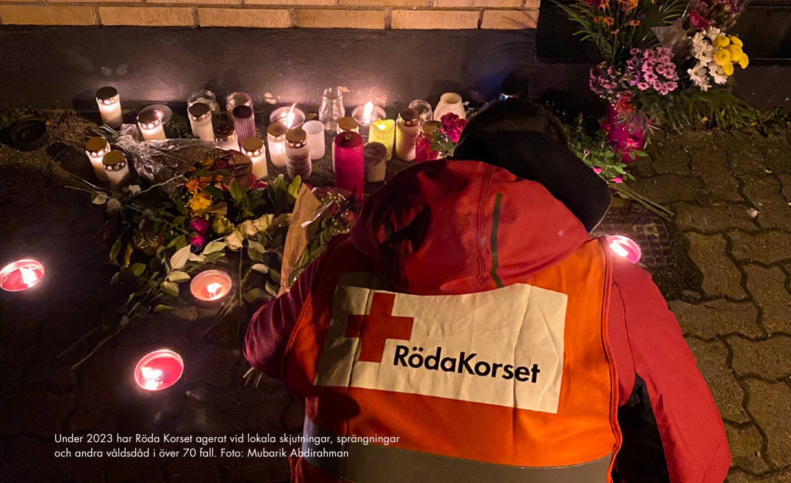
Under 2023 har Röda Korset agerat vid lokala skjutningar, sprängningar och andra våldsdåd i över 70 fall.

Det finns idag nästan ingen forskning som i en svensk kontext tittar på hur den förhöjda våldsnivån påverkar individer och bostadsområden. Den här rapporten är därför en viktig pusselbit när det gäller att förbättra arbetet med att stödja