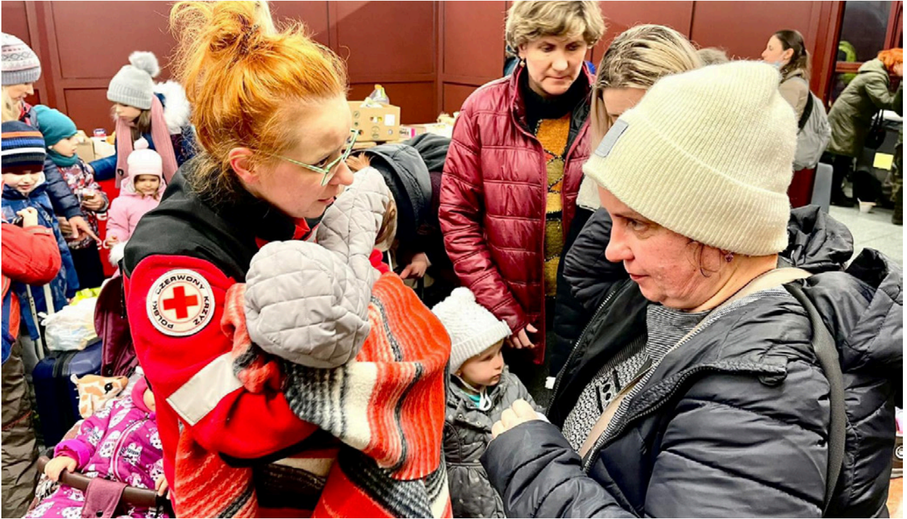
→ Tre dagar efter krigsutbrottet. Kvinnor och barn anländer till järnvägsstationen i Przemysl, Polen.