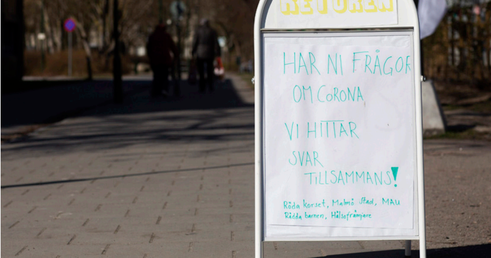
Gemensam informationsskylt på Lindängen i Malmö med Röda Korset, Malmö stad, Malmö Universitet, Rädda Barnen och områdets hälsofrämjare som avsändare.