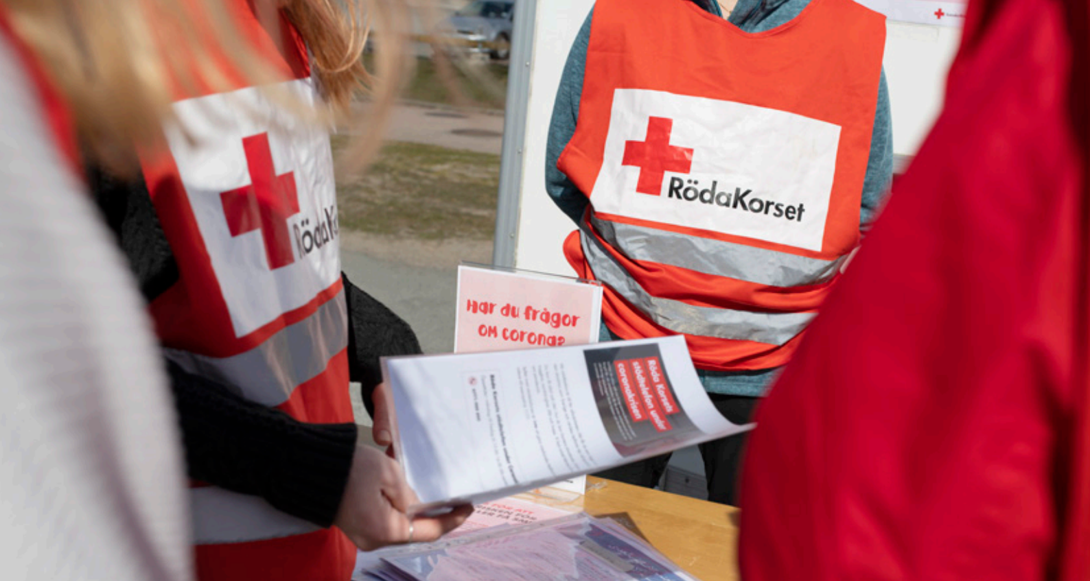
Frivilliga delar med sig av broschyrer på informationsinsatsen i Tynnered våren 2020.

informationsinsatserna gjordes därför djupintervjuer med grupper och enskilda personer om upplevelsen av pandemin. Så här sa en 65-årig kvinna i Tynnered sommaren 2020: