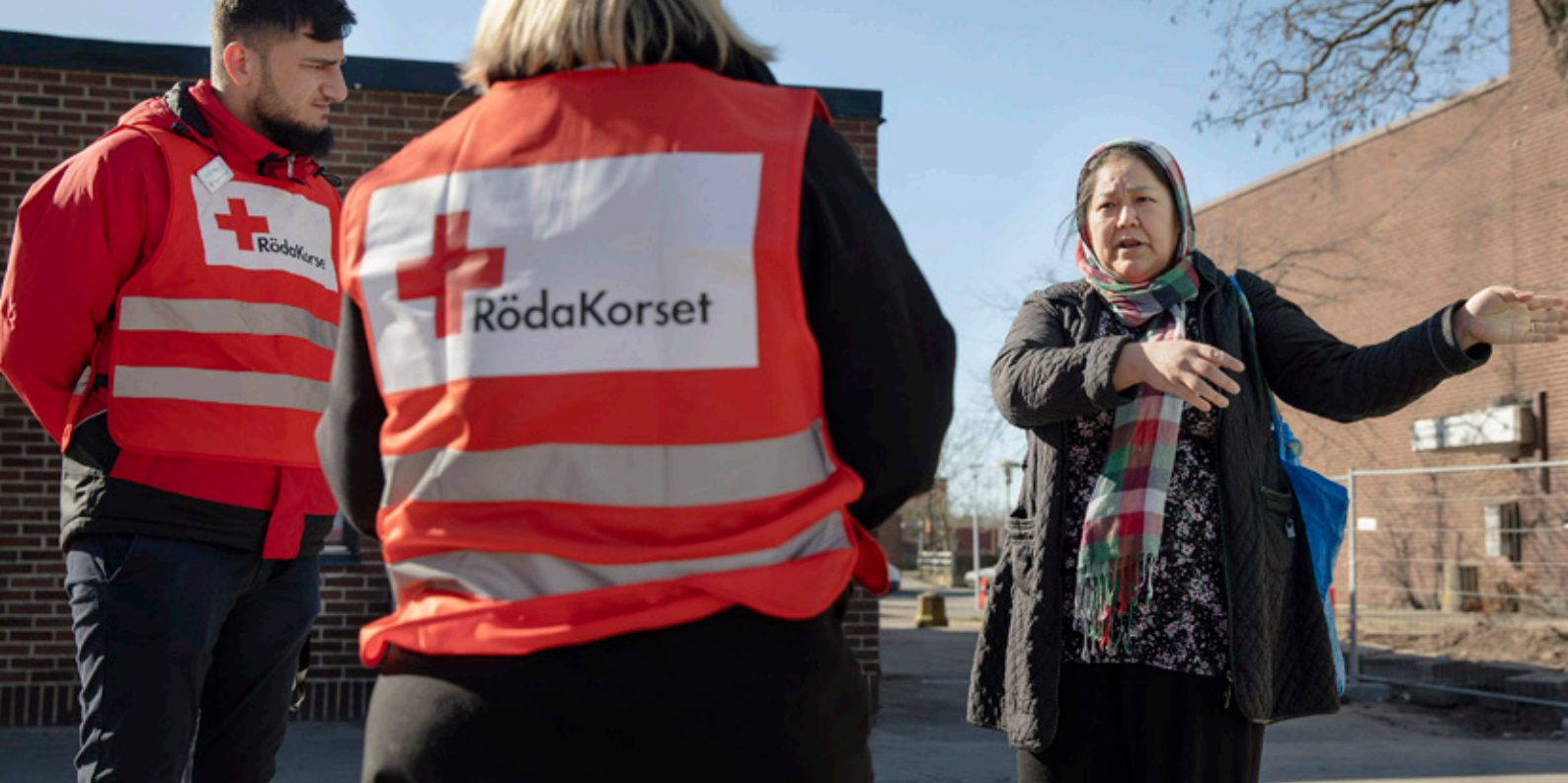
På plats på Lindängen: Kobra talar om sin corona-oro med Fadel och Sara från Röda Korset.