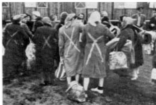
Holländskor från Ravensbrück i Padborg

Så fort Rödakorsdetachementet i Friedrichsruh fick besked om resultatet av förhandlingarna med Himmler påbörjades förberedelserna för att hämta kvinnorna i Ravensbrück.