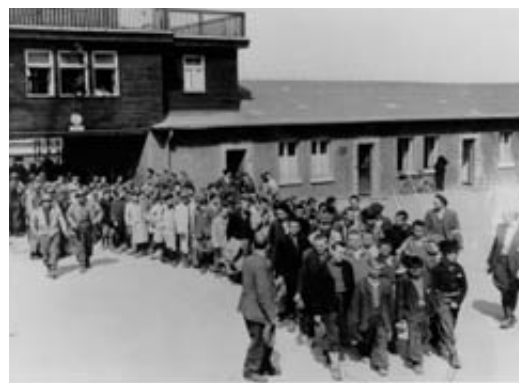
Manliga fångar i läger

Cirka 1 700 skandinaviska fångar fanns i Neuengamme när aktionen inleddes och ytterligare 600 hade tyskarna transporterat dit. Fram till den totala evakueringen av Neuengammeläget hade svenska detachementet transporterat dit cirka 5 000 fångar (inkl de fångar som redovisas i ett senare kapitel i denna rapport, nämligen tukthusfångarna, skandinaviska kvinnor från Ravensbrück m f l)