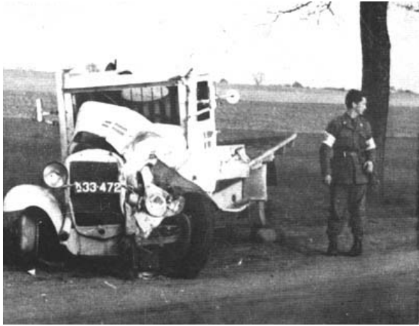
Sönderskjuten RK bil

På kvällen den 24 april anlände en kolonn ledd av löjtnant Hallqvist till Ravensbrück. Kolonnen hämtade 706 kvinnor av olika nationalitet och gav sig av mot Danmark. Man övernattade i en skog och delade dagen därpå upp kolonnen i två grupper. Hallqvists grupp som tagit vägen över Schwerin attackerades av en "Tiefflieger", ett lågflygande allierat