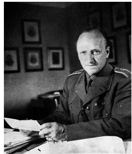
Överste Gottfrid Björck

Färden från Hässleholm skedde i två transportenheter eftersom alla fordon inte fick plats på färjan till Köpenhamn. Första enheten avgick den nionde mars och den andra den tionde. Före avfärd kom order från UD om att bilarna skulle målas vita. Hela natten pågick arbetet med att måla bussarna. En av transportenheterna var redan lastad på Köpenhamnsfärjan och hela Malmös målarkår kallades in för att få bilarna målade. Arbetet avslutades på överfärden till Danmark.