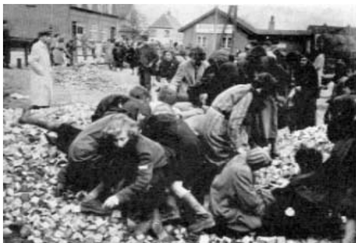
Utsvultna kvinnor från Ravensbrück