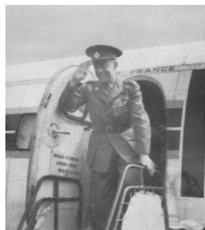
Folke Bernadotte - vice ordförande i Svenska Röda Korset

Under några dramatiska veckor, från mitten av mars till början av maj 1945, räddades drygt 15 000 fångar ur tyska koncentrationsläger. Bland dem fanns nästan 8 000 norrmän och danskar. Utöver skandinaverna befriades medborgare från ett tjugotal länder, främst Frankrike och Polen. Hur många av dem som var judar har aldrig gått att säkert fastställa. Ett av skälen är att Sverige inte registrerade trosbekännelse när fångarna togs emot.