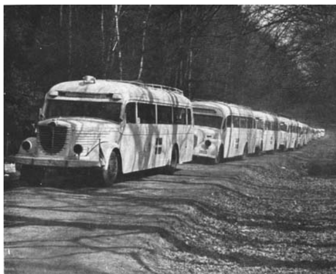
Danska bussar på väg

Den 19 april anlände Bernadotte till Friedrichsruh där stämningen var tämligen dyster. Det hade kommit ett meddelande om att alla transporter skulle stoppas och den tyska förbindelseofficieren trodde inte att transporterna skulle kunna fortsätta. Men senare samma dag kom plötsligt en