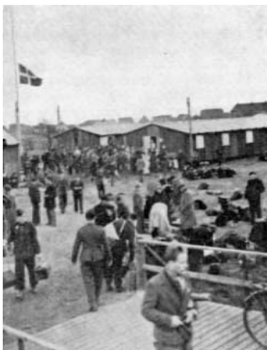
Karantänstationen i Padborg