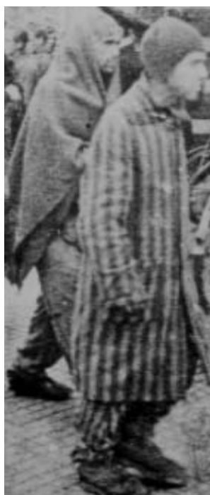
Manlig fånge går iland

Efter evakueringen av skandinaver från Neuengamme fanns det tiotusentals fångar av olika nationalitet kvar. De evakuerades av tyskarna och transporterades med järnväg till Lübeck under perioden 20-26 april. De stuvades ombord på flera fartyg i hamnen och levde under omänskliga förhållanden. Dr Hans Arnoldsson fick i ett anonymt brev den 29 april vetskap om denna evakuering och en förfrågan om hjälp för fångarna på ett av fartygen, "Athena". Arnoldsson erbjöd de tyska myndigheterna att ta hand om 250 fångar från Frankrike, Belgien och Holland. Totalt fanns 2 200 fångar ombord, mest rysar. Arnoldsson hade inte resurser att transportera fler fångar men erbjöd sig att gå ombord för att se om han kunde hjälpa till. Han fick dock inte tillstånd till detta.