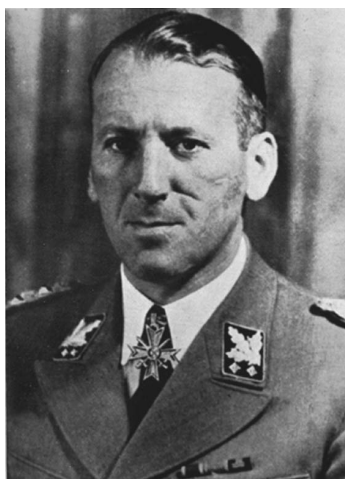
Oberguppenführer Ernst Kaltenbrunner

Efter en formell instruktion från Röda Korsets ordförande, Prins Carl, flög Bernadotte den 16 februari till Berlin för att inleda förhandlingarna. Inledningsvis sammanträffade Bernadotte med den tyske utrikesministern Joachim von Ribbentrop, chefen för säkerhetstjänsten Ernst Kaltenbrunner och Himmlers adjutant Walter Schellenberg.