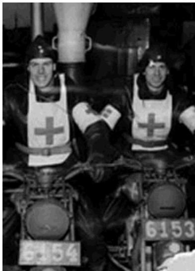
Motorcyklister i Rödakorsdetachmentet

till att bussarna fick köras in en åt gången med en svensk chaufför och en tysk vakt. Bussarna eskorterades alltid av Gestapomän som såg till att detachmentet följde de föreskrifter tyskarna satt som villkor för transporterna. De följande tio dagarna gjordes totalt sju resor till Sachsenhausen. Man lämnade Friedrichsruh klockan fem på eftermiddagen och anlände till lägret klockan ett på natten. Den tidsramen var den säkraste för att undvika flyganfallen mot Berlin. Under tiden mellan den 16 och 30 mars hämtades 2 161 fångar från Sachsenhausen.