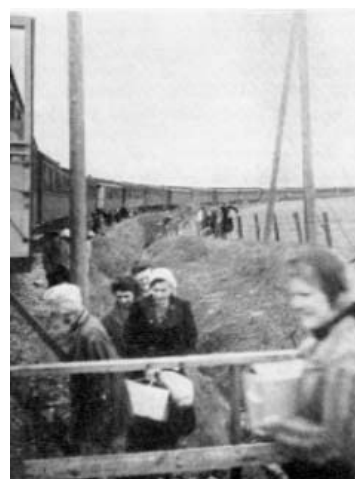
Franska kvinnor lämnar hotelltåget i Padborg