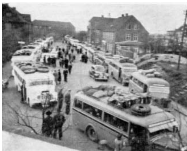
Danska bilar kommer till Padborg

Expeditionen hade nu pågått en månad och en stor del av manskapet var