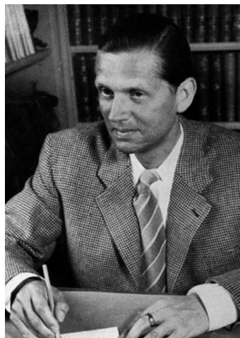
Brigadeführer Walter Schellenberg

Den 19 februari inledde han förhandlingarna med Heinrich Himmler själv. Svenske utrikesministerns direktiv till Bernadotte inför dessa förhandlingar var att "söka utverka i Tyskland internerade norrmäns och danskars sändande till Sverige eller Danmark". Mer preciserade än så var inte anvisningarna. Günther gav Bernadotte mer eller mindre fria händer att söka uppnå så konkreta och omfattande medgivanden som möjligt. Förhandlingarna omfattade alla i Tyskland internerade norska och danska medborgare, följaktligen även dem av judisk börd.