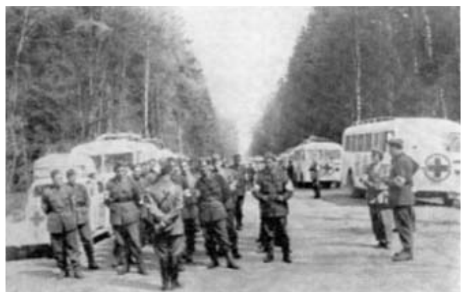
Delar av det svenska Rödakorsdetachmentet