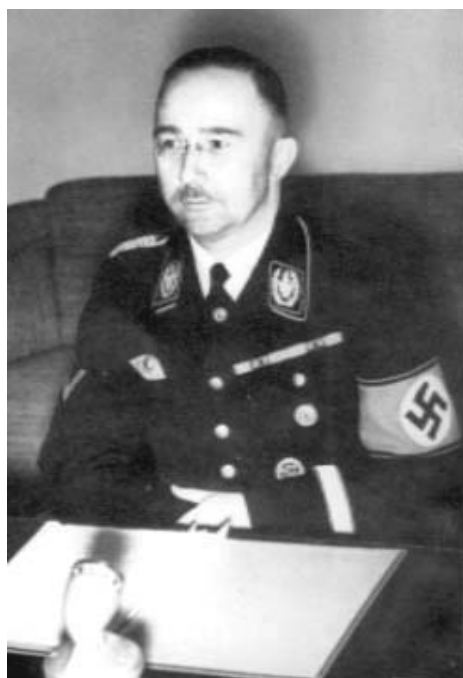
Inrikesminister och SS-chef, Heinrich Himmler

en varnade landets nyhetsredaktioner för att publicera reportage som kunde utgöra en risk för Sveriges förmåga att vidmakthålla sin neutralitet och säkerhet. Regeringen förbehöll sig rätten att dra in tidningar som intog en antitysk hållning. Man behövde dock sällan nyttja denna makt utan förlitade sig till "informella" påtryckningar och redaktörernas "goda omdöme". För att kontrollera den information den svenska pressen mottog inrättades 1940 Informationsstyrelsen. Denna form av "informell censur" visade sig vara mycket effektiv och de flesta journalister respekterade regeringens krav. Undantag fanns dock. Den mest betydande antinazistiske publicisten var Torgny Segerstedt på Göteborgs Handels- och Sjöfartstidning, som man befarade skulle kunna dra in Sverige i kriget genom sina kampanjer.